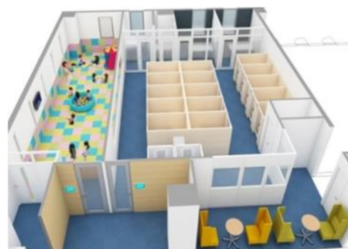
※左:ちよくちよく...和泉多摩川店オープンスペース、右:ちよくちよく...品川東口店キッズスペース

昨今の待機児童問題対策により、保育園の数は順調に増加していますが、小学校や幼稚園の急なお休み、夏休みなどの長期休暇、そして普段家で子供の面倒を見てくれる家族の急用などの際に、ワーキングマザー・ファザーが仕事を休んで対応しなければいけない状況は変わりません。ザイマックスのキッズスペース付きサテライトオフィスは、そういった有事の際に、執務環境の整ったサテライトオフィスに子連れで出勤するという選択